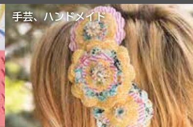
手芸、ハンドメイド