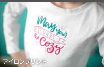
アイロンプリント