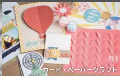
カード・ペーパークラフト